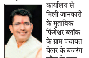
मिली जानकारी के मुताबिक फिंगेश्वर ब्लॉक के ग्राम पंचायत बेलर के बजरंग चौक के पास

टिन शेड निर्माण कार्य के लिए 15 लाख रुपए, ग्राम पंचायत धुरसा, सिरांरकला, कसेरूडीह में टिन शेड निर्माण के लिए अलग-अलग 10-10 लाख रुपए की प्रशासकीय स्वीकृति प्रदान की गई है। निर्माण कार्यों के लिए क्रियान्वयन एजेंसी का दायित्व सीईओ जनपद पंचायत फिंगेश्वर को सौंपा गया है।