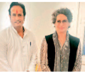
■ चुनाव को लेकर कांग्रेस स्क्रीनिंग कमेटी की चेयरमैन प्रियंका गांधी ने की विस्तृत समीक्षा